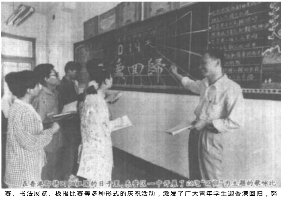
在东营市工商联第三届会员代表大会期间，市工商联组织举办了“为农村输送科技人才”为主题的演讲比赛、书法展览、板报比赛等多种形式的庆祝活动，激发了广大青年学生迎香港回归，努力学习，报效祖国的爱国热情。